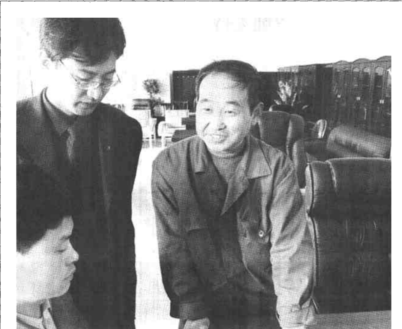
东营区文汇办招商项目——东营市雅特木业有限公司，综合家具的国际趋势和潮流，引进德国、意大利等国的新材料、新设备，不断推出新型产品。目前新推出的6大系列产品备受消费者青睐。

河口讯 河口区仙河镇探索出了一条污水净化二次利用变为宝的路子，被当地群众誉为“利民富民工程”。 一条逶迤的神仙沟贯穿仙河镇，每天有12000多立方米的工业废水、城镇污水注入这条河沟并流入渤海，污染相当严重。而仙河镇有180余万亩盐碱滩待开发，但又苦于水资源匮乏。近两年，该镇瞅准了这股滔滔不绝的废水，实施了城镇污水漫流净化与盐碱地养殖芦苇项目。他们在有关专家及技术人员的指导下，投资近30万元开发了5000亩苇田，兴建了2处污水沉淀池，将黑油油的污水引入沉淀池沉淀净化，出水口加置石油类悬浮物过滤网，日照一个月进行氧化处理，然后再将污水导入有芦苇的单元畦内，充分利用土壤、芦苇根以及水生生物的综合净化，每池始终保持20公分的水漫流进入苇田。城镇排弃的废水净化二次利用，使昔日的有害水成为苇田的可靠水源。经过处理后的废水水质肥沃，芦苇生得色黄、秆高、茎直、竹性强，深受苇农们的欢迎。去年项目责任人在芦苇价格大幅度滑坡的情况下，还增加收入12万多元。同时，废水的利用，减少了城区工业废水和生活污水对神仙沟等河渠及地下水的污染，有效地改善了渤海海域的生态环境。 (王振东 徐迎春 温云增)