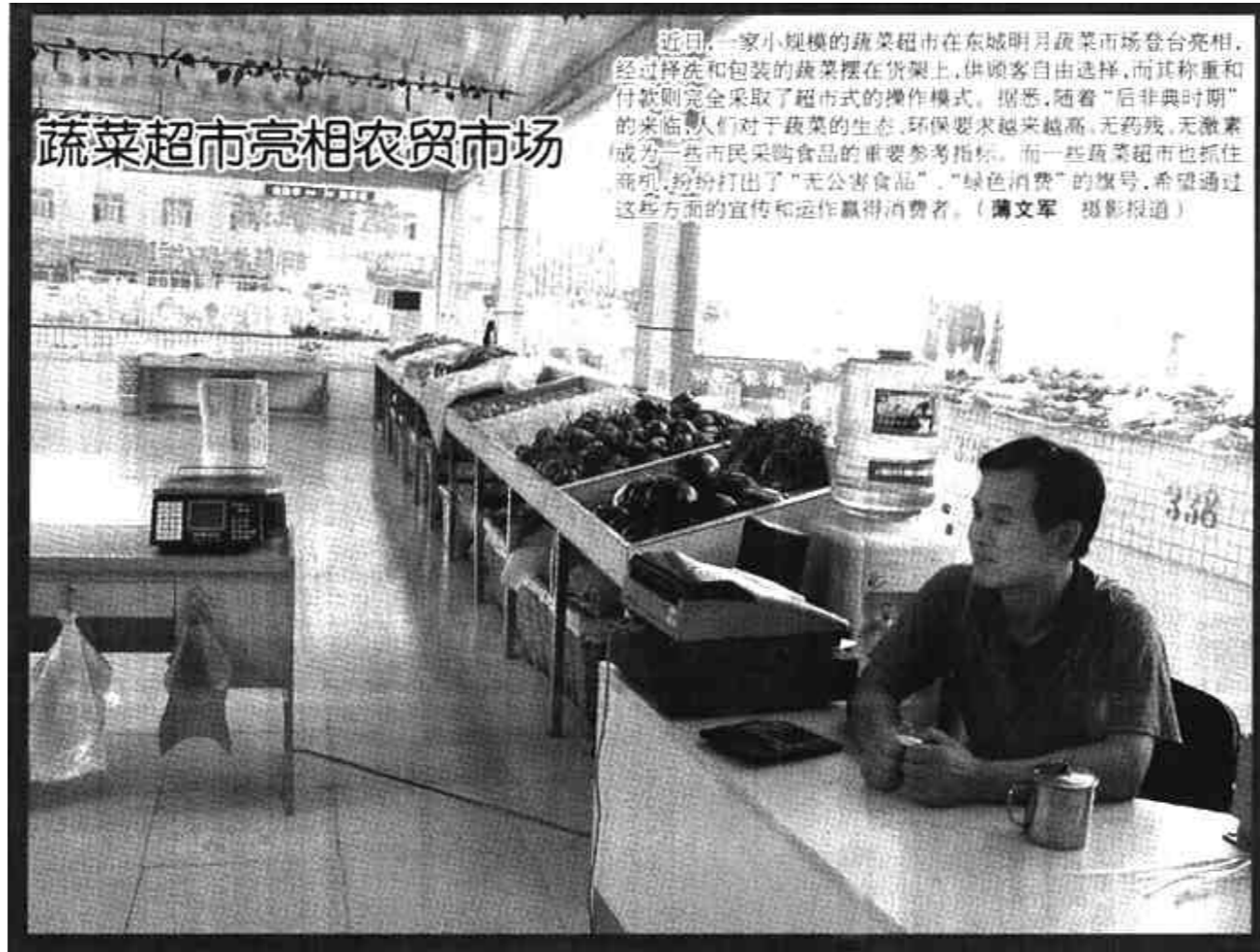
近日，一家小规模的蔬菜超市在东城明月蔬菜市场登台亮相。经过挑选和包装的蔬菜摆在货架上，供顾客自由选择，而其称重和付款则完全采取了超市式的操作模式。据悉，随着“后非典时期”的来临，人们对于蔬菜的生态、环保要求越来越高，无公害、无污染成为一些市民选购食品的重要参考指标。而一些蔬菜超市也抓住商机，纷纷打出了“无公害食品”、“绿色消费”的旗号，希望通过这些方面的宣传和运作赢得消费者。(隋文军 摄影报道)

工农村消防工作管理机制已初现成效。自5月份以来，该村通过消防助理的监督检查，并经村消防工作会议研究决定，清除了村内村民擅自存放的2个油罐，消除了一大火灾隐患；5月中旬，该村李某的农用拖拉机发生火灾，村民利用消防器材箱内的灭火器迅速将火灾扑灭，避免了更大的事故。(赵磊 王少华)