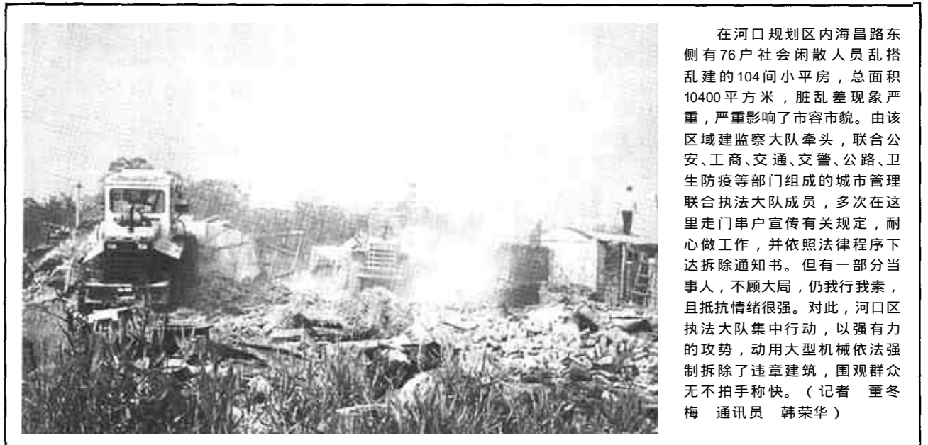
在河口规划区内海昌路东侧有76户社会闲散人员乱搭乱建的104间小平房，总面积10400平方米，脏乱差现象严重，严重影响了市容市貌。由该区域建监大队牵头，联合公安、工商、交通、交警、公路、卫生防疫等部门组成的城市管理综合执法大队成员，多次在这里联合执法宣传有关规定，耐心做工作，并依照法律程序下达拆除通知书。但有一部分当事人，不顾大局，仍我行我素，且抵抗情绪很强。对此，河口区执法大队集中行动，以强有力的攻势，动用大型机械依法强制拆除了违章建筑，围观群众无不拍手称快。(记者 董冬梅 通讯员 韩荣华)

青里透红的果实、一群淳朴的农家人，吸引着无数游人，前来消暑、游览、放飞心情。 记者发现，该旅游园路两旁是茂盛的芦苇荡，草桥沟里有鱼儿翻浪游起的白浪，接下来就是满眼的绿意。几个红顶的小茅草镶嵌其中，远处看去真的有一“万绿丛中一点红”的味道，在绿色丛中，有盛开的不知名的小花，散发着淡淡的、迷人的清香。此处水、绿融为一体，合着远处的牧羊人吹起短笛声声，使人真切地回到了自然，回归了自然。(王志峰 刘新宇)