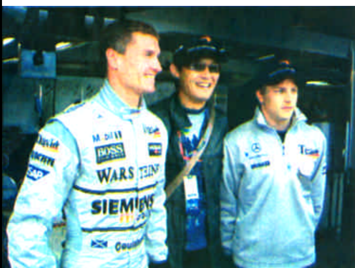
继海造访迈凯伦车队，与莱科宁及库特哈德合影